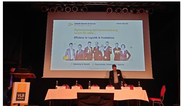
Vortragsbühne im Kühlschiff

Was tut sich im Bereich der alternativen Antriebe im Schwerlastverkehr, wie kann die fortschreitende Digitalisierung das Leergut-Handling effizienter gestalten und was für Möglichkeiten bieten sich aktuell auf dem Arbeitsmarkt? Das mit Spannung erwartete Highlight war natürlich der Bericht über die Realisierung des integrierten Abfüll- und Logistikkonzepts der Störtebeker Braumanufaktur. Zum Ende des ersten Veranstaltungstages kamen die Teilnehmer in den Genuss einer exklusiven Führung durch Sudhaus, Abfüllung und hochgradig automatisierter Logistik.