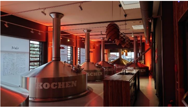
Blick in das Sudhaus

Denn in diesem Jahr hatte sich die VLB ein ganz besonderes Schmankerl einfallen lassen. Es ging in den hohen Norden zur Braumanufaktur Störtebeker nach Stralsund.